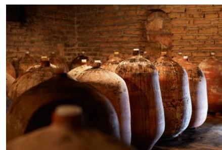
■Jarres (ジャー) 木樽と異なり、香りやタンニンがワインに移す事無く熟成が可能。

2018年ヴィンテージからは、ワインの熟成に「ジャー」と呼ぶ手作業で造られたテラコッタの甕を使用しています。この容器はワインの香りや味わいに影響を与える事のないニュートラルな素材の為、より純粋に果実とテロワールをワインに表現出来ると考えます。フレデリックは試行錯誤を繰り返した結果、現在は「粘土」と「砂岩」から造られた2種類のジャーを使用しています。低温で焼く「粘土」のジャーは通気性が高く、微量の空気置換により熟成が促されます。一方で「砂岩」のジャーは高温で焼く為に硬く空気の透過性が低くなります。熟成時にはこの二つのジャーを25%ずつ使用し、残りの50%を木樽で熟成させる事で、ワインの味わいのバランスをとっています。尚、木樽は1年使用後にDRCから購入した樽を、ブドウの状態に合わせて、6年程度まで使用しています。新樽はテロワールの要素をマスクしてしまうと考えている為、使用していません。